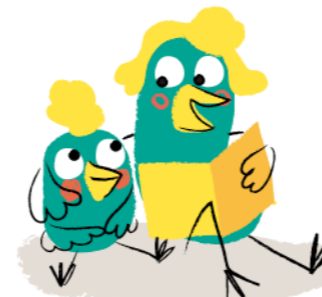
Illustration : © Mylène Rigaudie / Milan Presse 2020.

GEO ADO , tous les mois une fenêtre ouverte sur notre monde complexe et passionnant.