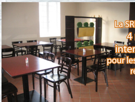
Le RIA d'Avignon après les travaux de rénovation effectués en 2010.

En 2015/2016, des travaux de rénovation, d'amélioration et de mise aux normes sont prévus dans trois des RIA de la région (Marseille, Toulon et Avignon).