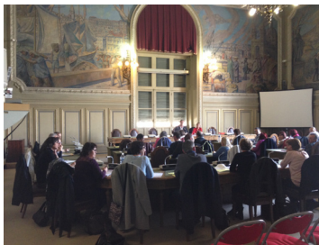
La commission plénière de la SRIAS est présidée par le Président, et se déroule en présence du Préfet de Région ou du Secrétaire Général pour les affaires Régionales

Le Président réunit chaque commission en tant que de besoin au cours de l'année pour faire le bilan des actions et examiner les actions à entreprendre.